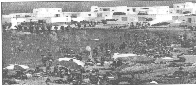
Complexe touristique de Tipaza